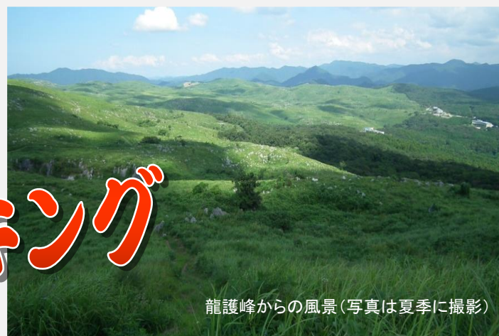
龍護峰からの風景(写真は夏季に撮影)